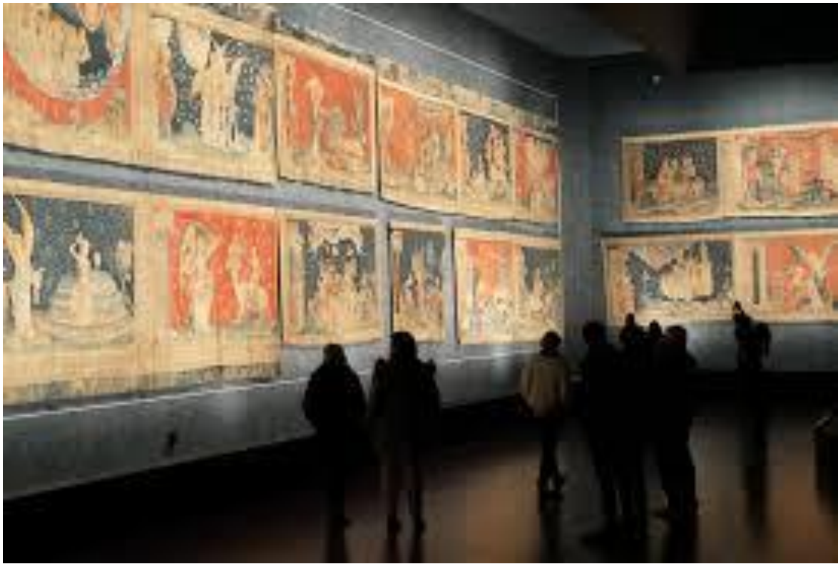
Inspiration-tapisserie de l'apocalypse angers.